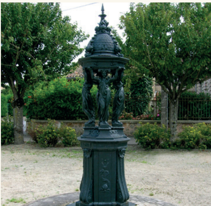
WALLACE Hauteur : 2.95 m