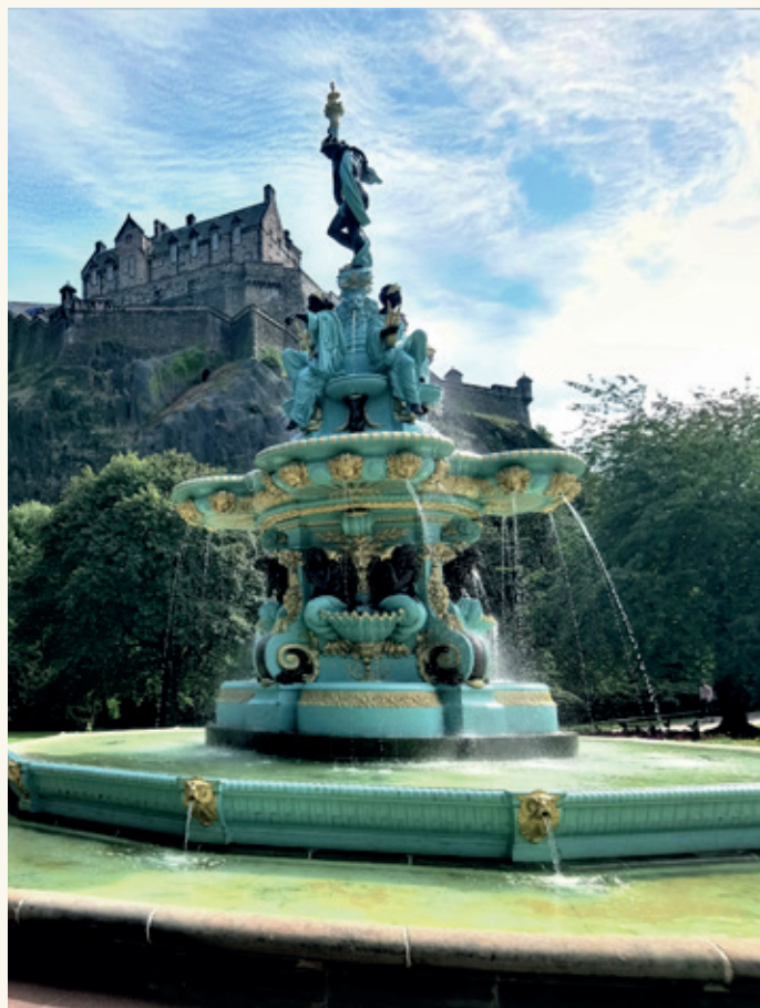
Fontaine d'Edimbourg (Ecosse)