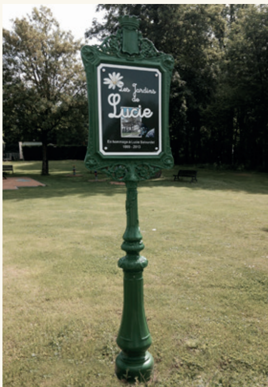
Porte affiche Hauteur : 2.50 m