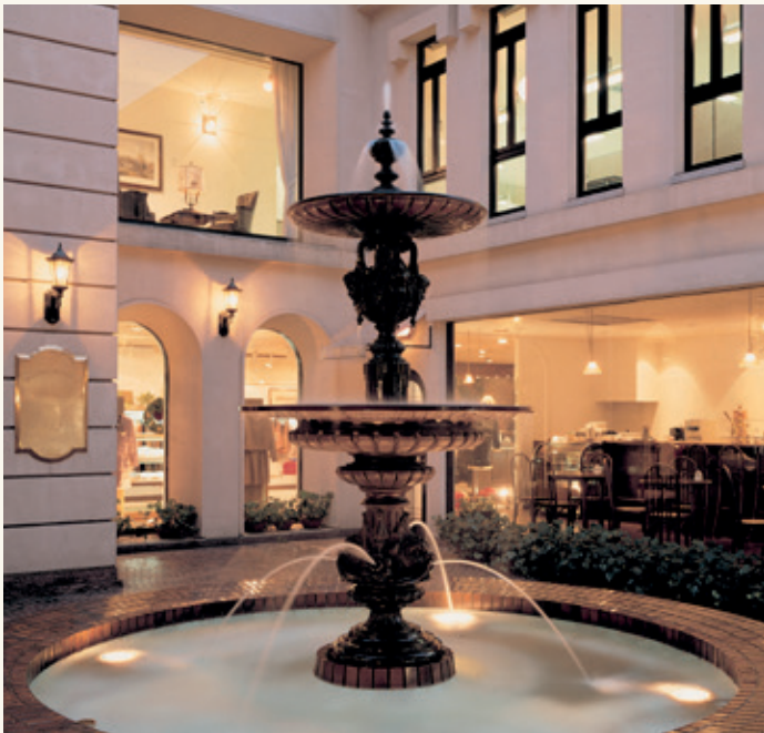
MONTIER-EN-DER Hauteur : 1.70 m à 3.70 m

Standing on a square, public fountains remain an essential element of street furniture. By the delicacy of their structure, their drawings and reliefs, by the warmth of the cast iron, these authentic works of art enliven and add to the places a supplement of unalterable soul.