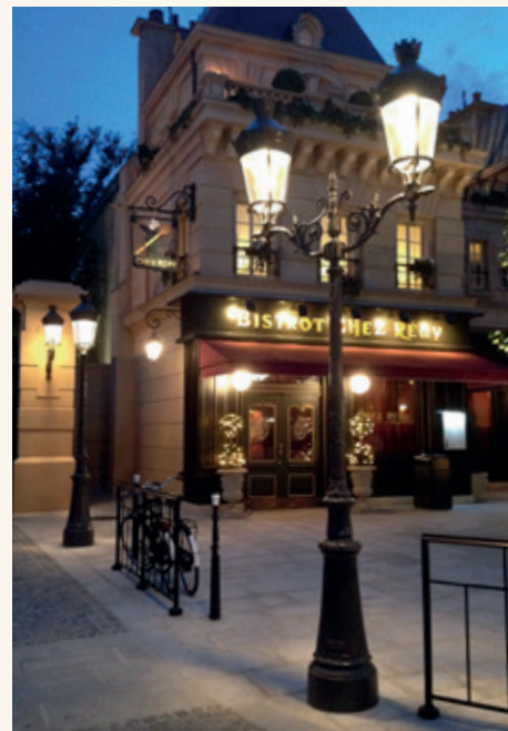
PARISIEN Hauteur : 2.85 m à 4.85 m Bouquet Trinité et lanternes Chenonceaux III