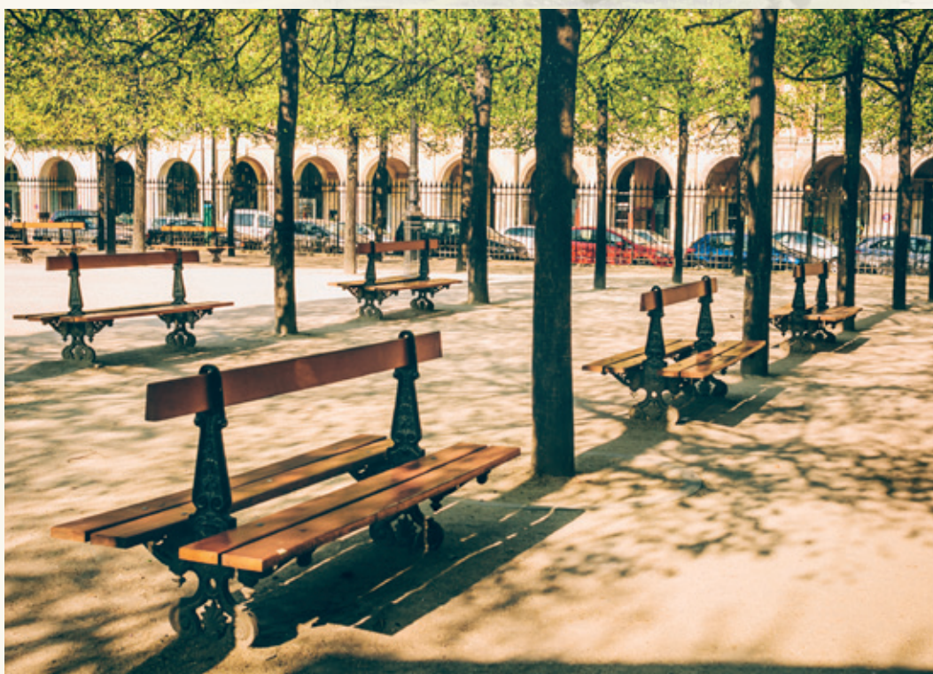
Banc «VILLE DE PARIS» Longueur : 2.00 m Largeur : 0.77 m