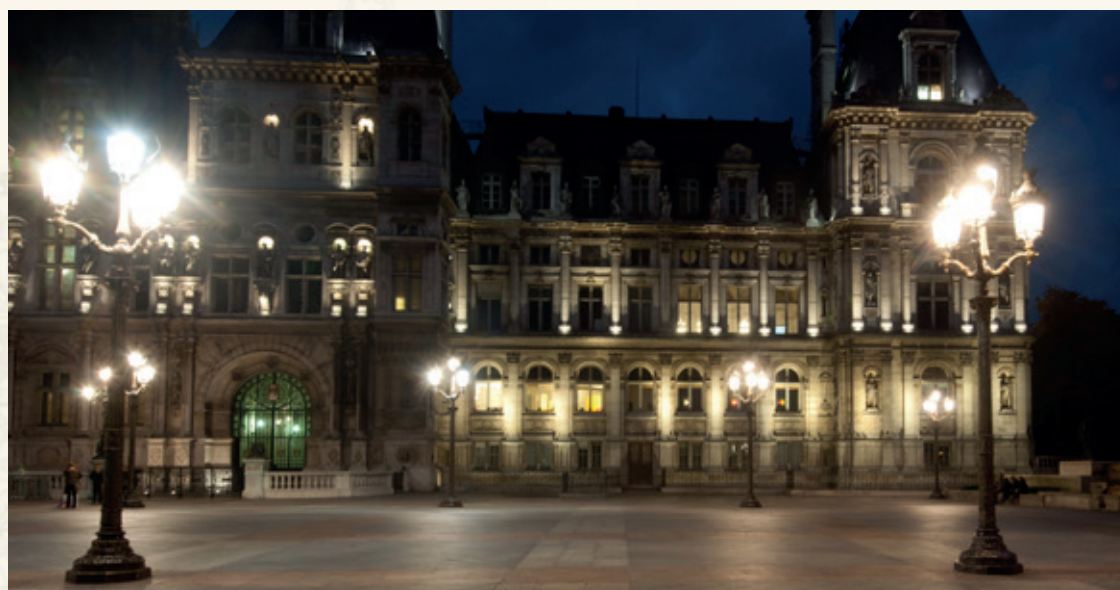
CHAMPS-ELYSEES Hauteur : 3.90 m Bouquet Vendôme et lanternes Chenonceaux III