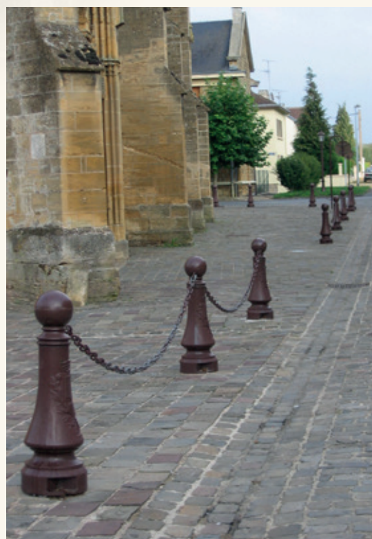
Bollard «HÔTEL DE VILLE» Height: 0.91 m