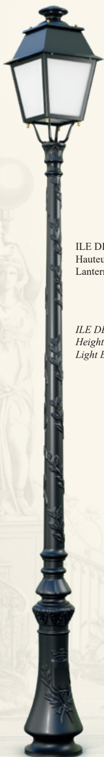
ILE DE FRANCE Hauteur : 2.90 m ou 3.20 m Lanterne Beauregard II

Rich or simple, the candelabra and light fixtures elegantly illuminate the forecourt and gardens, boulevards and public squares. These stylish supports combine the aesthetics of an era rich in works of art with the robustness and modernity of powerful light sources. Made from molds of origin, they integrate harmoniously with the sites of characters to dress light the most beautiful avenues of the world.