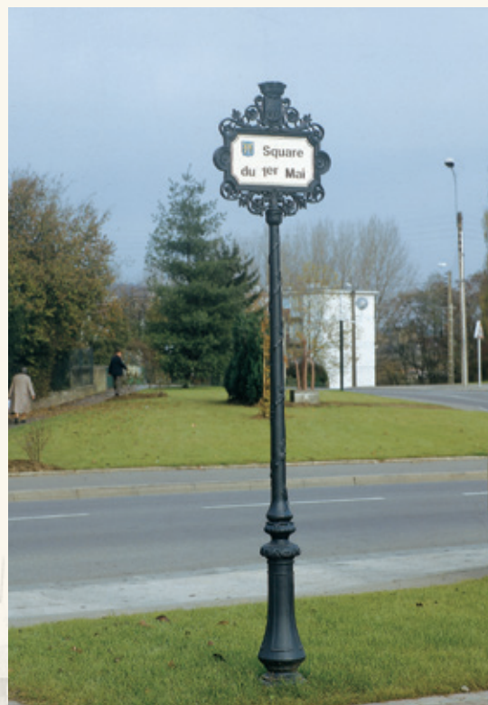
Porte enseigne Hauteur t: 3.20 m