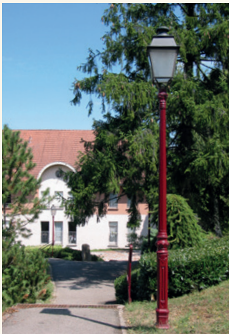
DIRECTOIRE Hauteur : 2.76 m à 3.78 m Lanterne Beauregard II