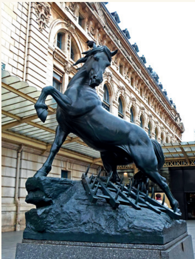
Cheval à la herse Musée d'Orsay (Paris)