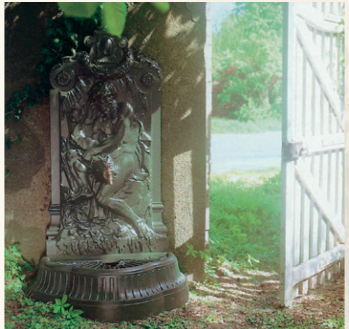
NEPTUNE Hauteur : 1.60 m