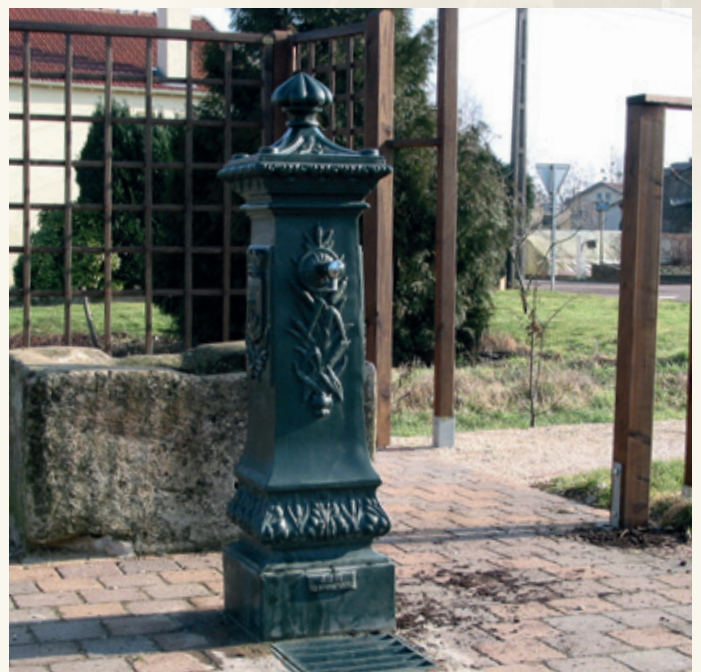
VILLE DE PARIS Hauteur : 1.32 m