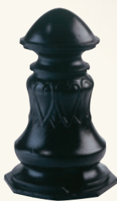
Borne «PLACE DE LA FONTAINE» Hauteur: 0.37 m

Major pedestrian facilities for an urban quality of life, the terminals combine the reliability of a robust material with sober or decorative lines that are essential for integrating into classified sites