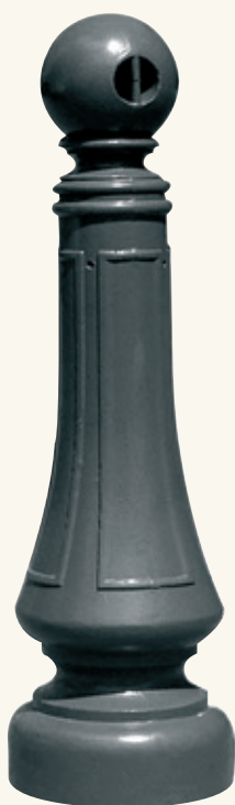
Borne «PLACE D'ARMES» Hauteur : 0.96 m