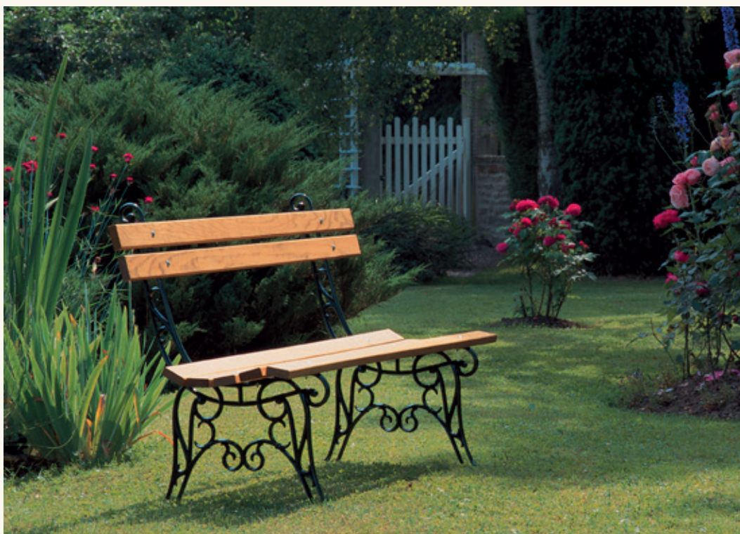
Banc «LORRAINE» Longueur : 1.80 m Largeur : 0.61 m

Their charm always seduces and highlights these privileged places.