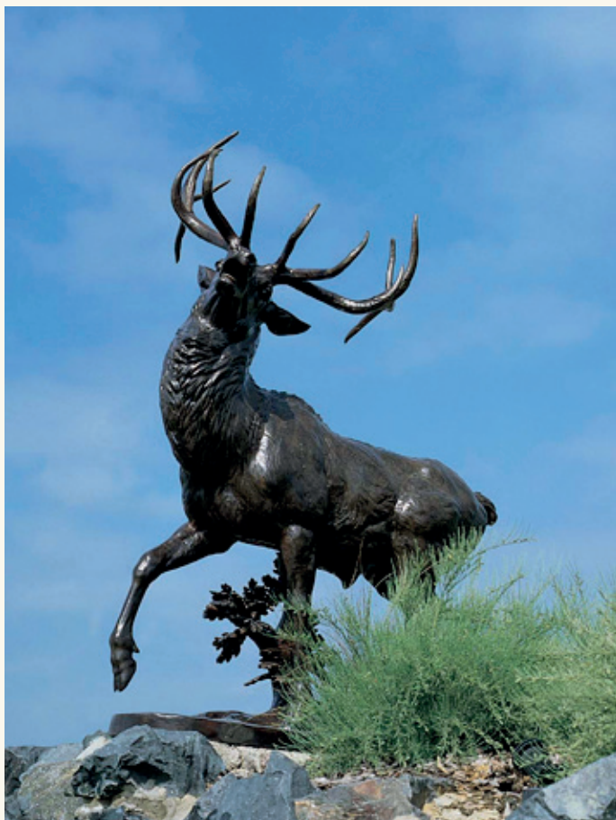
Statue de Cerf d'Amérique