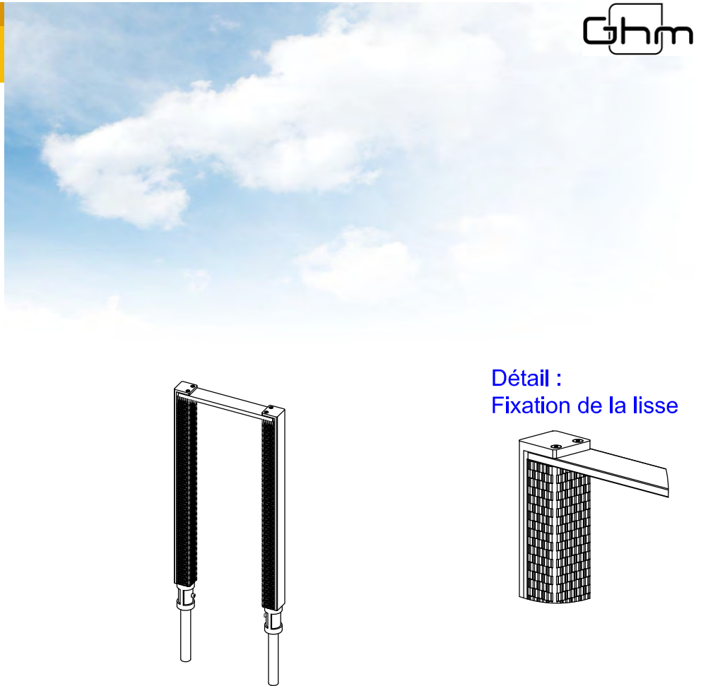
Détail : Fixation de la lisse

Livraison : Support vélo livré en kit avec allonge de scellement.