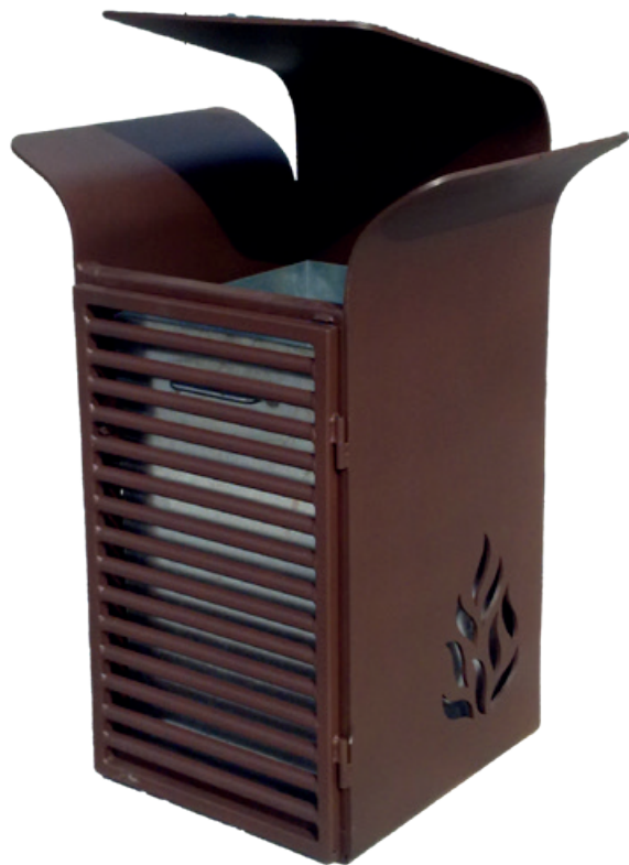
Version porte acier